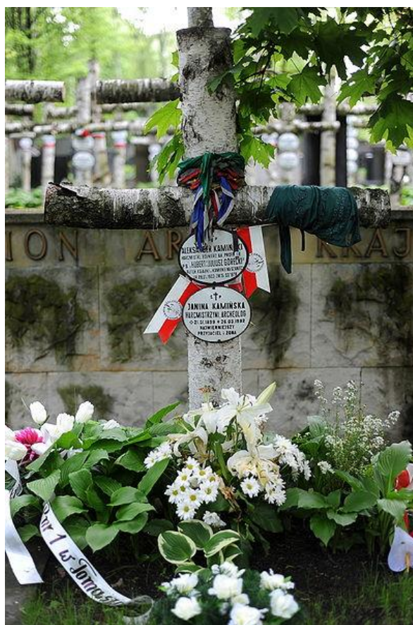
Grób Aleksandra Kamińskiego na Cmentarzu Wojskowym na Powązkach